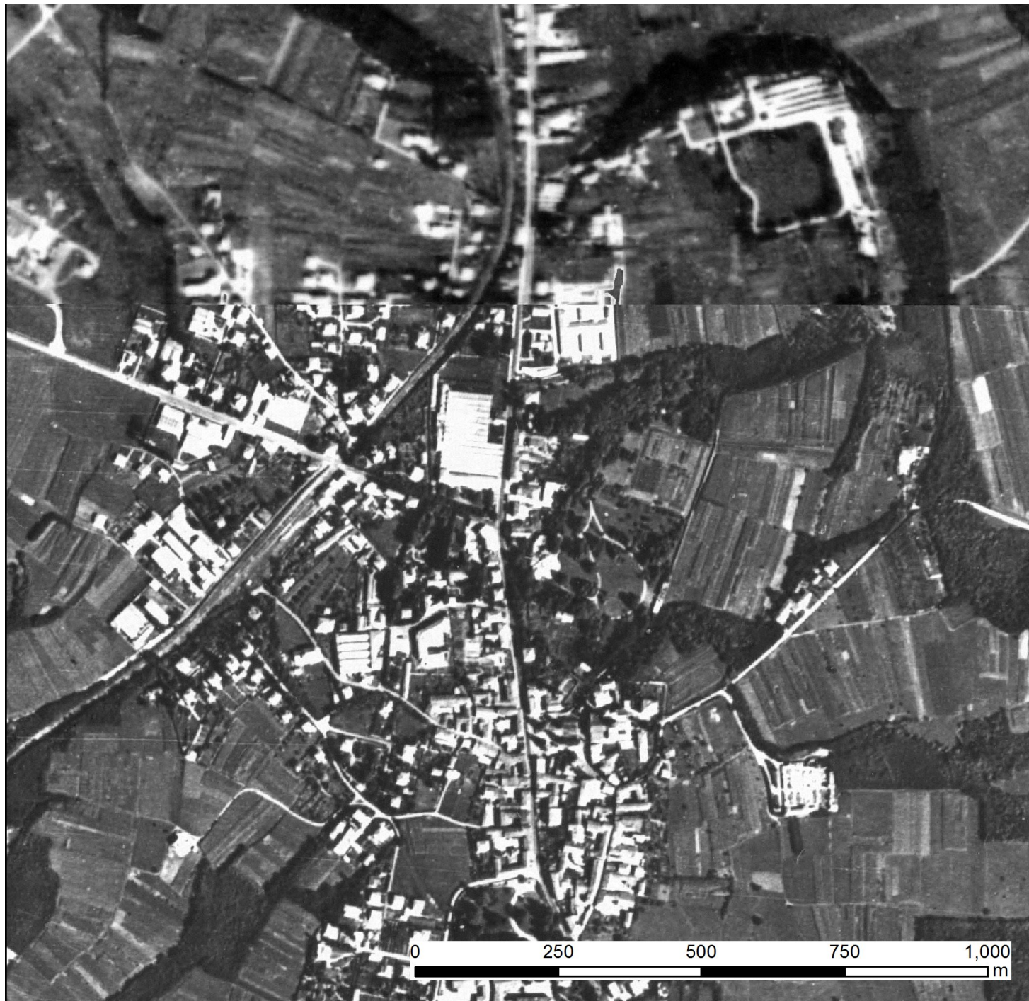
Immagine mosaicata delle foto Aeree Volo GAI (Gruppo Aereo Italiano) 1954-55