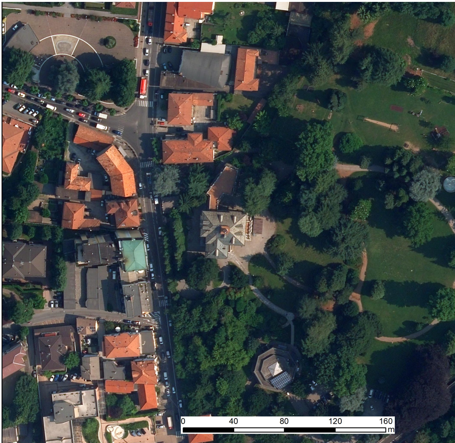
Ortofoto 2015 AGEA