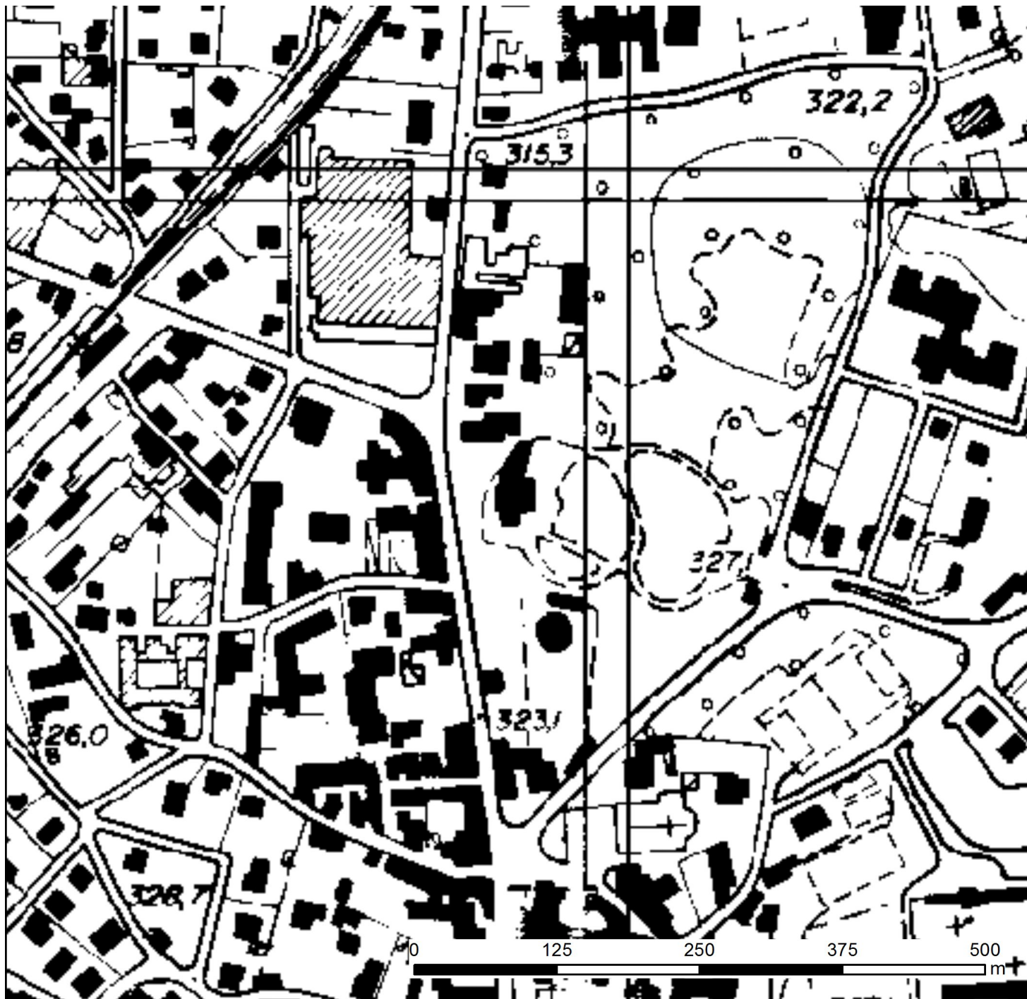
Carta Tecnica Regionale (aggiornata dai Database Topografici)